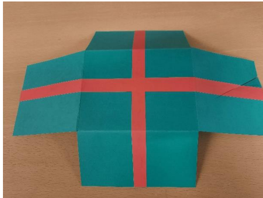
Pilt nr. 2